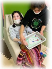
バレンタイン製作

気に入ってくれる子が多かったです！可愛らしい作品が出来上がり、ブランコに飾って季節を楽しんでいます。