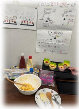
クッキング ～ポテトサラダ～

想像以上に、皆の反応が薄かったので、今後の課題です。。 クッキング では、ポテトサラダを作りました。じゃがいもを潰したり、ゆで卵の殻を剥いて混ぜました。初のおかず作りでした！昼食に美味しく頂きました。